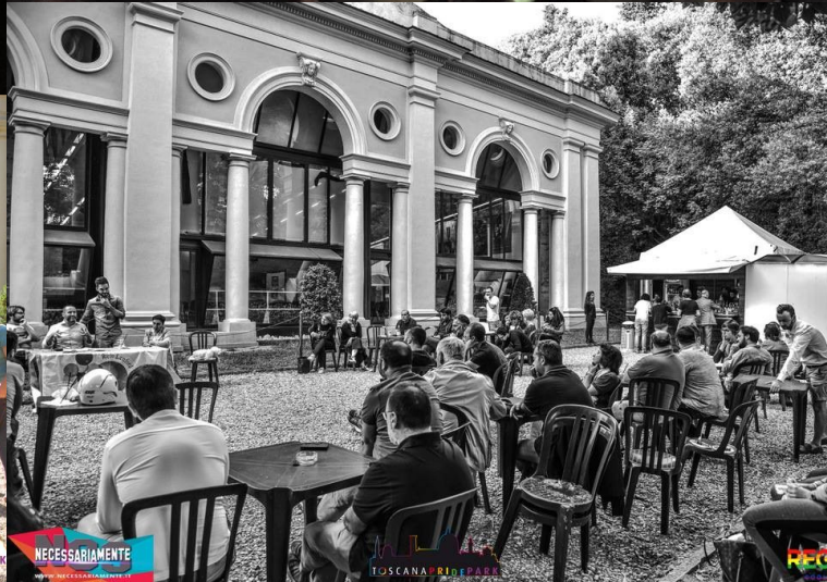
Dall'edizione 2016 del TOSCANA PRIDE PARK