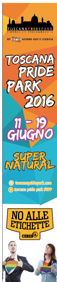
Due banner all'ingresso della Limonaia, cm 50x250