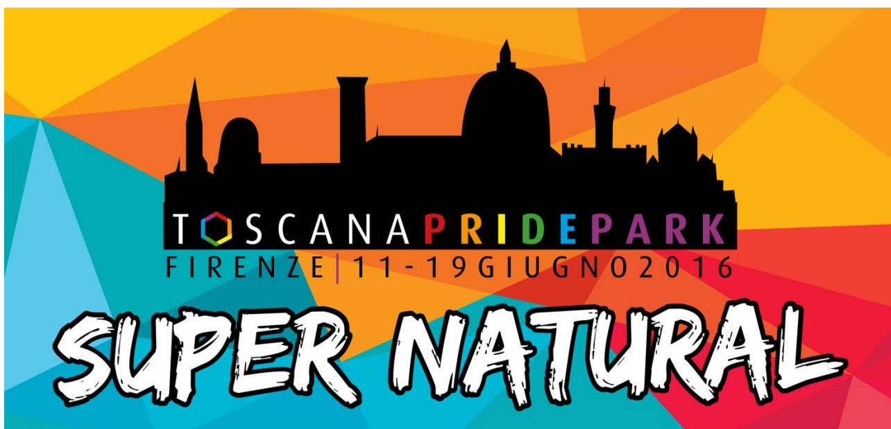
Banner sul carro per la a sfilata del Toscana Pride (11 giugno 2016), cm 200x100