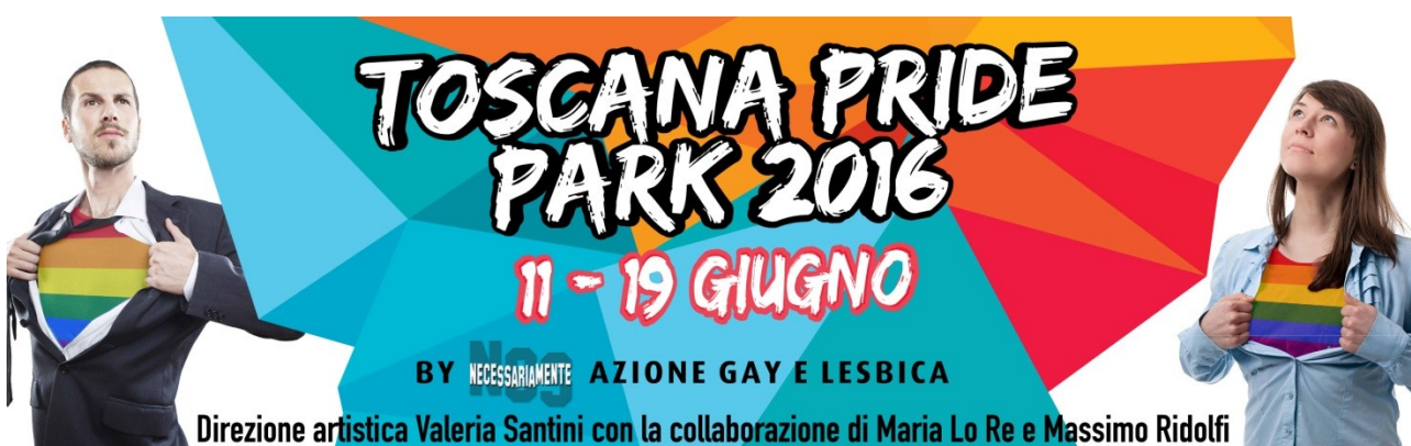
Banner sul carro per la a sfilata del Toscana Pride (11 giugno 2016), cm 210x60