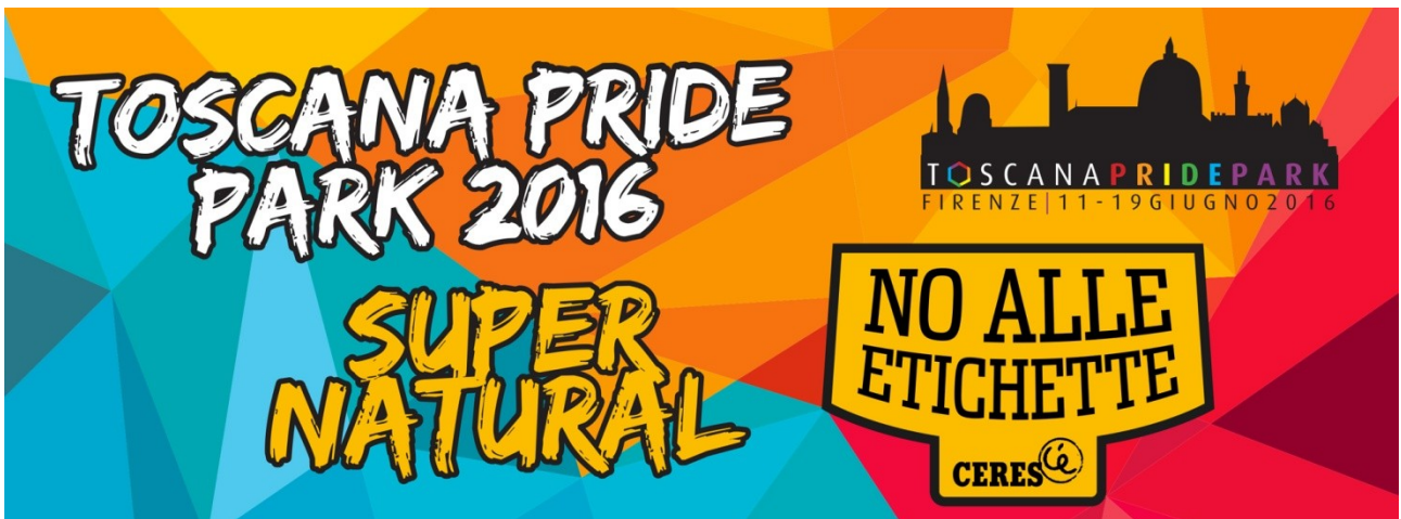
Banner all'interno della Limonaia, cm 270x100