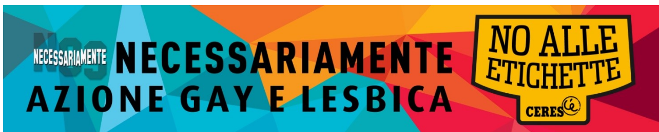
Banner sul carro per la a sfilata del Toscana Pride (11 giugno 2016), cm 300x60