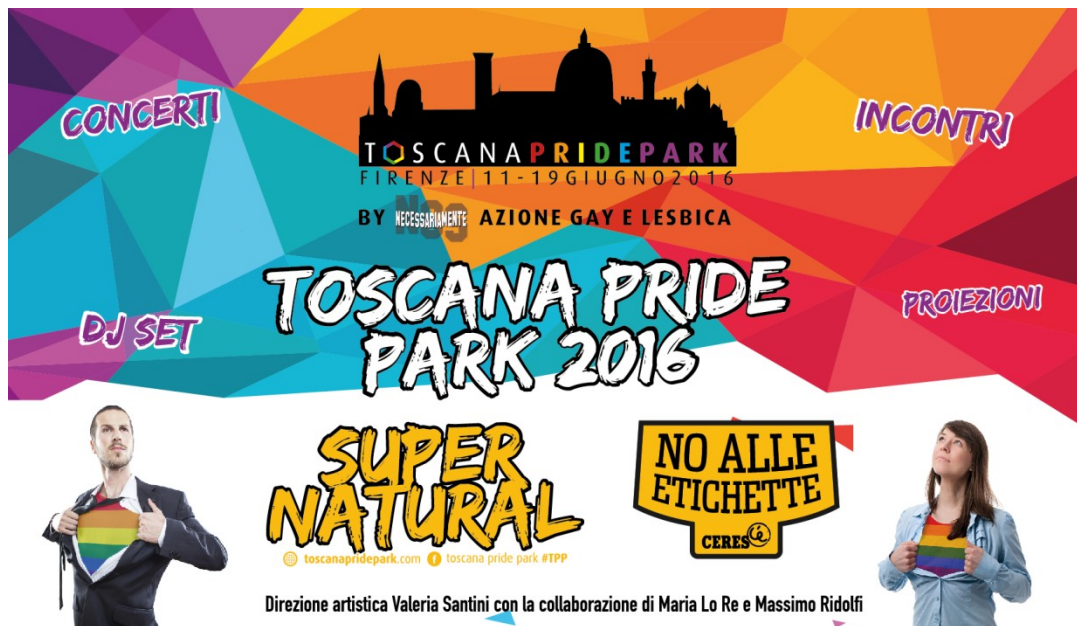
Banner all'ingresso della Limonaia, cm 460x250