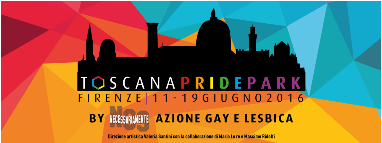
Banner all'interno della Limonaia, cm 400x150